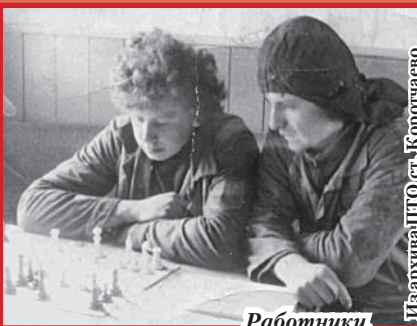
Работники вагонного депо в обеденный перерыв, ст. Коротчаево, 1988 г.