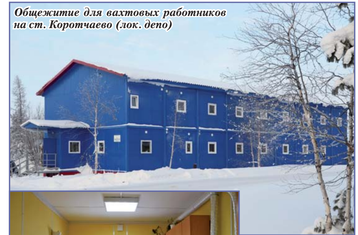
Общежитие для вахтовых работников на ст. Коротчаево (лок. депо)