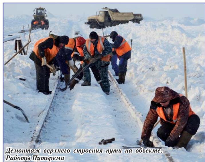
Демонтаж верхнего строения пути на объекте. Работы Путьрема