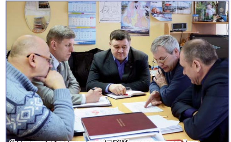
Совещание по проекту склада ГСМ-локомотивного депо