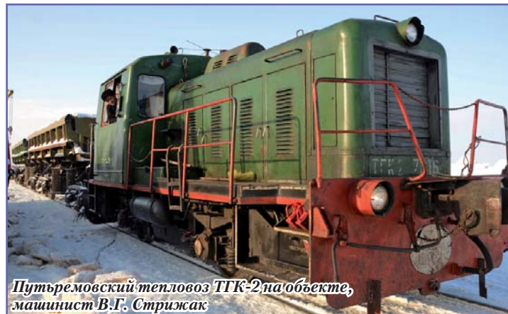
Путьремовский тепловоз ТГК-2 на объекте, машинист В.Г. Стрижак

перегон Тихая – Тыдыл (590-й, 591-й км), перегон Тыдыл – Нартовая (610-й км), перегон Нартовая – Фарафонтьевская (625-й, 626-й, 627-й км), перегон Новый Уренгой – Пангоды 694-й, 695-й, 696-й км, перегон Ево-Яха – Селькупская – 9-й, 10-й км;