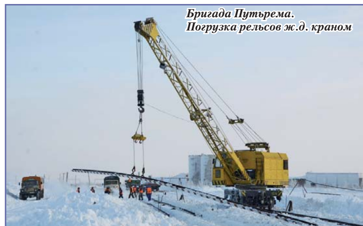
Бригада Путьрема. Погрузка рельсов ж.д. краном