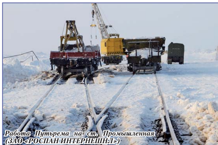
Работа Путьрема на ст. Промышленная (ЗАО «РОСПАН ИНТЕРНЭШНЛ»)