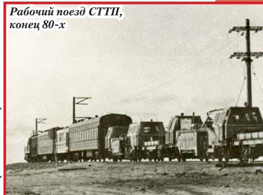
Рабочий поезд СТТП, конец 80-х