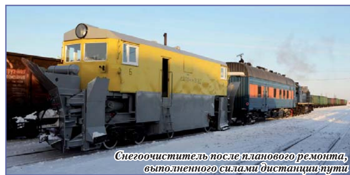
Снегоочиститель после планового ремонта, выполненного силами дистанции пути