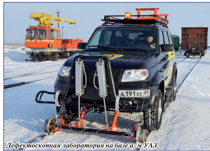
Дефектоскопная лаборатория на базе а/м УАЗ