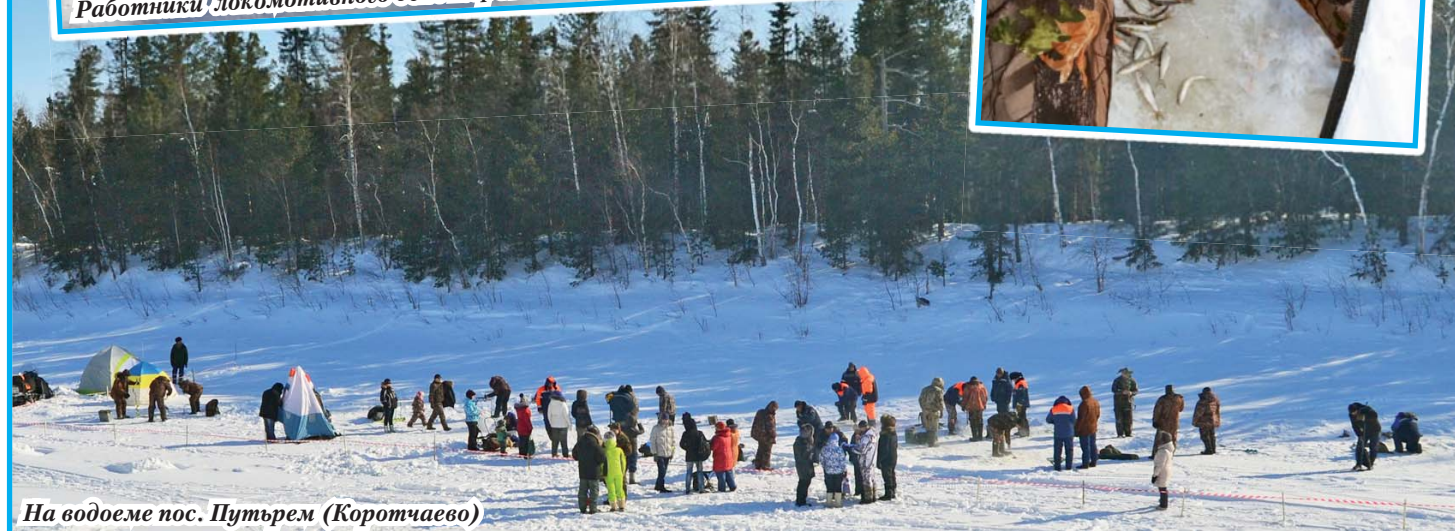
На водоеме пос. Пустьрем (Коротчаево)

• На развитие культурно-массовой работы до 0,3 % от ФОТ (культурные, оздоровительные, спортивные мероприятия, детские новогодние подарки) выплачено порядка 3-х млн руб. ежегодно.