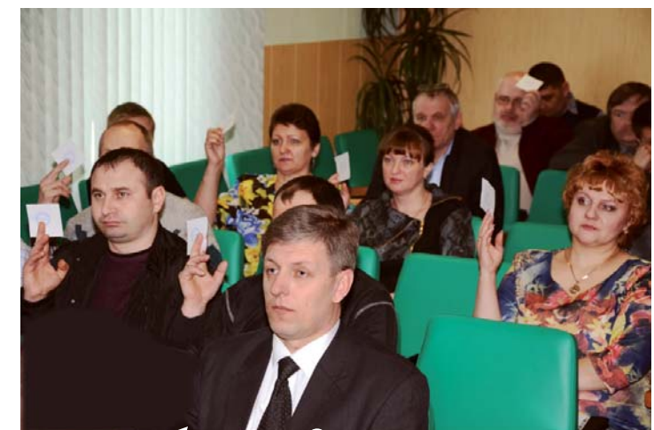
Делегаты конференции трудового коллектива

• В целях привлечения к работе в Компанию молодых специалистов, работодатель предоставляет им дополнительные гарантии и компенсации в соответствии с Положением «О молодом специалисте Открытого акционерного общества «Ямальская железнодорожная компания», утвержденным распоряжением Генерального директора ОАО «ЯЖДК» с учетом мотивированного мнения ППО ОАО «ЯЖДК». ■