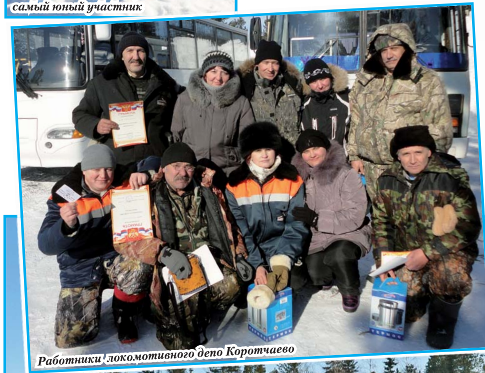
Работники локомотивного депо Коротчаево