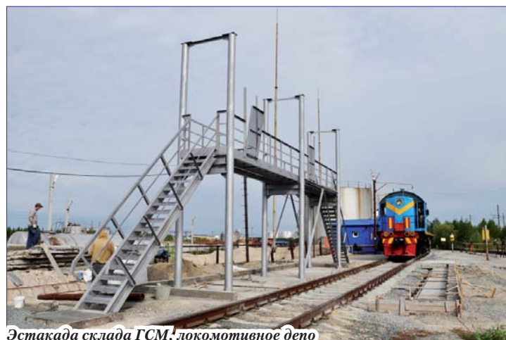
Эстакада склада ГСМ, локомотивное депо