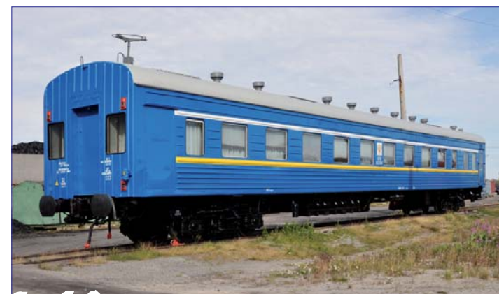
Служебный вагон–салон. Работу по покраске выполнил Б.М. Андриевский

– выполнена наружная и внутренняя покраска напольных устройств на полигоне дистанции; – оборудовано помещение кладовой по ст. Тихая; – оборудовано помещение для хранения аппаратуры АВЗ–СЦБ на ст. Коротчаево, пост ЭЦ; ➔ 4