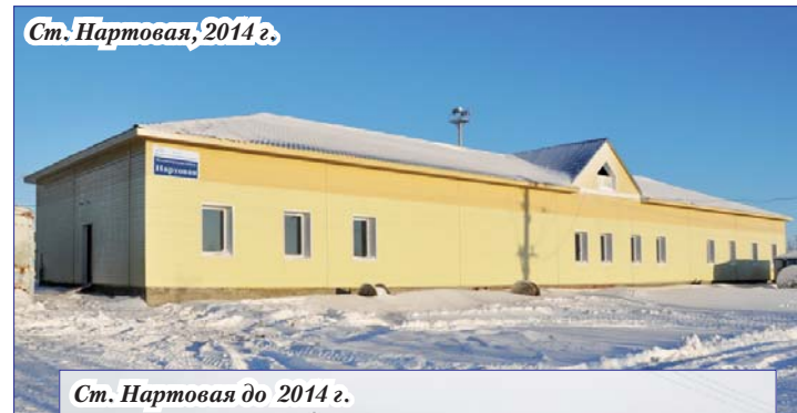
Ст. Нартовая, 2014 г.