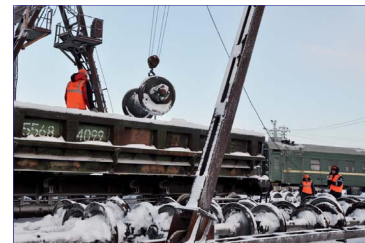
Ревизия колесных пар, вагонное депо