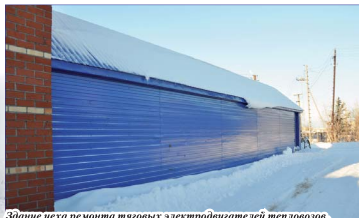
Здание цеха ремонта тяговых электродвигателей тепловозов, локомотивное депо