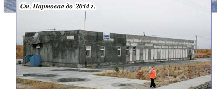
Ст. Нартовая до 2014 г.