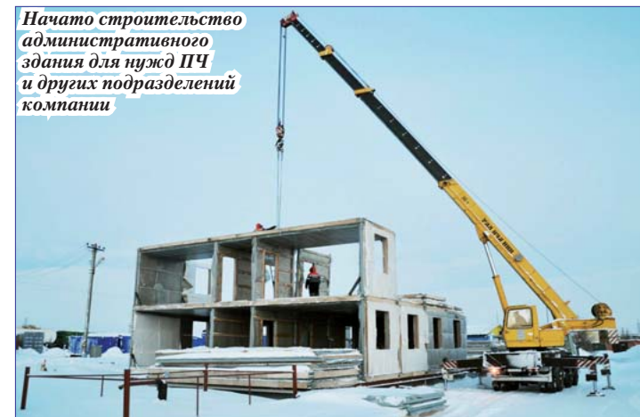
Начато строительство административного здания для нужд ПЧ и других подразделений компании

– 1 декабря 2004 г. на работу в ОАО «ЯЖДК» из ОАО «СТПП» принято 1005 чел., в настоящее время из них работают 346 чел. ■