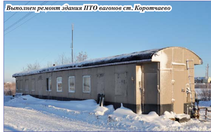
Выполнен ремонт здания ПТО вагонов ст. Коротчаево