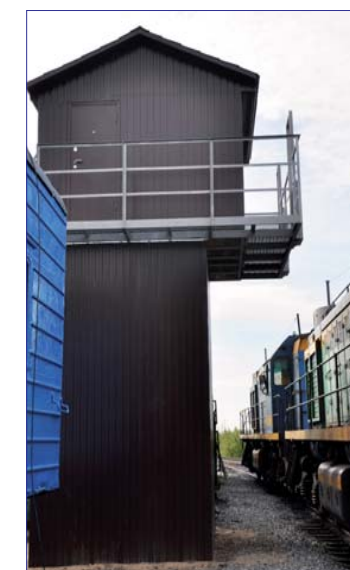
Пункт экологического контроля, локомотивное депо