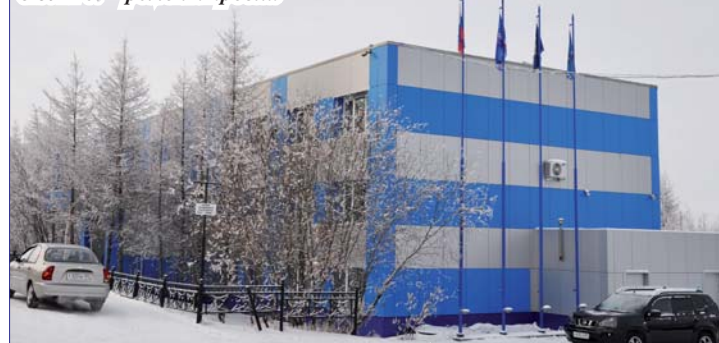
Внешний вид здания офиса № 1 ОАО «ЯЖДК» до 2013 г.