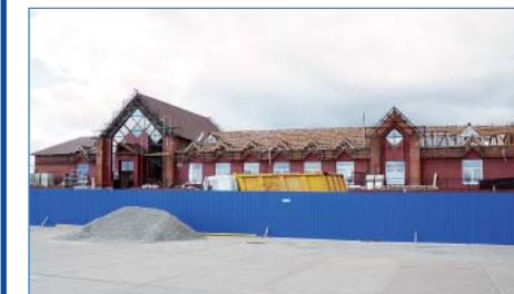
Капитальный ремонт здания вокзала ст. Коротчаево