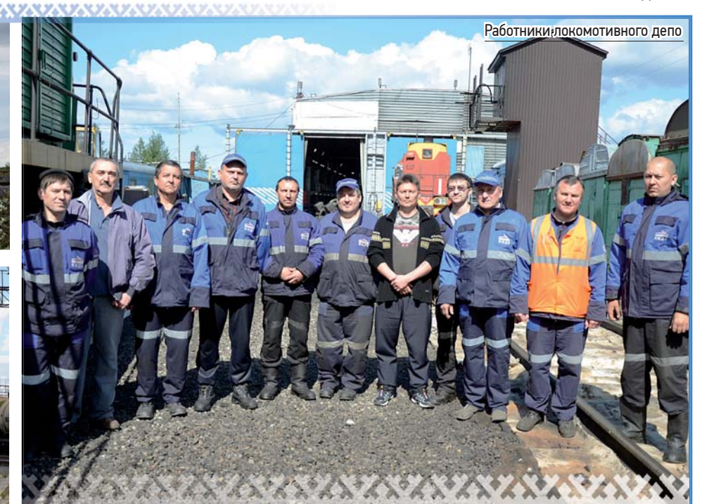
Работники локомотивного депо