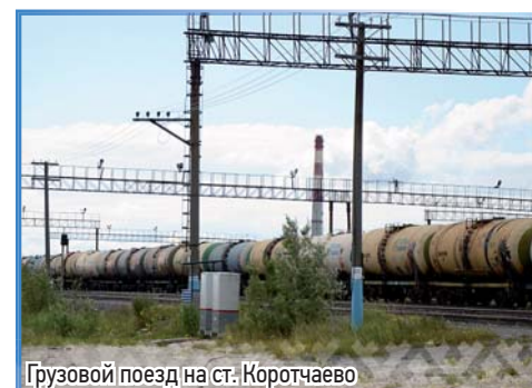
Грузовой поезд на ст. Коротчаево