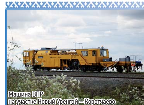
Машина ВПР на участке Новый Уренгой - Коротчаево

МИНИСТР ТРАНСПОРТА РОССИЙСКОЙ ФЕДЕРАЦИИ Е.И. ДИТРИХ