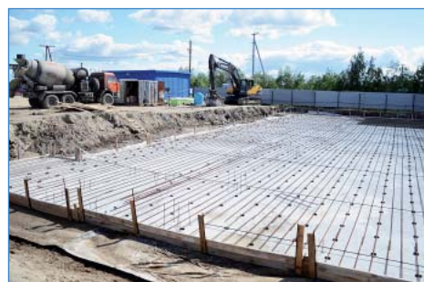
Строительство административно-бытового здания (АБЗ) на ст. Коротчаево