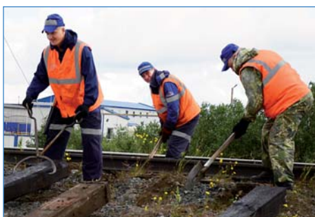
Путевые работы на перегоне Новый Уренгой – Фарафонтьевская