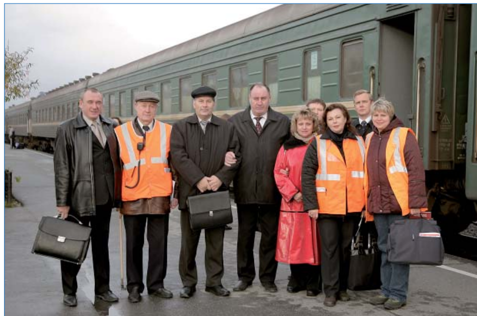
На комиссионном осмотре, 2007 г.